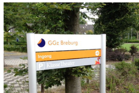
Slagboom: ingang GGZ