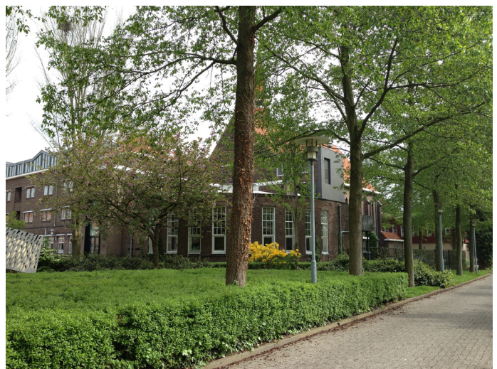
Zijaanzicht Klasse Theater

Mocht u geen parkeerplaats kunnen vinden in de wijk (vanaf 15.00 gratis) en op de parkeerplaats van de GGZ (€ 4,50 per dag), dan kunt u ook parkeren in de wijk Armhoefse Akker (gratis), aan de andere kant van Ringbaan Oost of op de parkeerplaats Spoorlaan op 3 minuten lopen afstand (betaald parkeren tot 15.00 uur, €0,90 per uur). Op de kaart op de volgende pagina kunt u zien waar deze gelegen zijn.