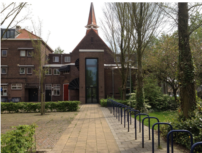
Ingang Klasse Theater

De uitrijkaarten (€ 4,50 per dag) zijn verkrijgbaar bij de bar in het Klasse Theater.